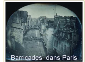
Barricades dans Paris

Pour aider les chômeurs, le gouvernement crée des ateliers nationaux mais ils coûtent cher à l'état et sont mal organisés : ils doivent fermer. Cette fermeture est à l'origine de la révolte des ouvriers en juin 1848 . Les manifestants mettent en place des barricades (construites avec les pavés des rues de Paris) pour se protéger. Le gouvernement réagit violemment : on comptera plusieurs milliers de morts parmi les insurgés (les manifestants) et les forces gouvernementales (policiers, soldats).