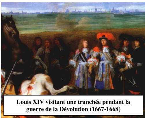
Louis XIV visitant une tranchée pendant la guerre de la Dévolution (1667-1668)

Colbert laisse l'image d'un excellent gestionnaire , même si les résultats économiques du règne peuvent paraître très discutables en raison des fortes ponctions causées par les dépenses militaires, les constructions et les largesses du roi. Il ne faut pas oublier que Louis XIV a encore régné 32 ans après la mort de Colbert : tant que le ministre fut aux affaires, les budgets ont été à peu près maîtrisés ; les déficits ne cessent de s'accumuler après lui .