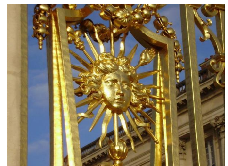
Emblème du Roi Soleil à Versailles