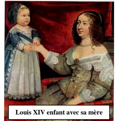
Louis XIV enfant avec sa mère

À la mort de son père Louis XIII en 1643, Louis XIV devient roi de France mais il ne peut gouverner car il n'a pas encore fait 5 ans. C'est donc sa mère Anne d'Autriche qui dirige le pays, assistée du cardinal Mazarin . La reine devient donc régente durant cette période.