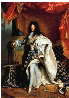
Louis XIV en 1701

La monarchie absolue prend alors la forme qu'elle conservera jusqu'à la Révolution française en 1789 .