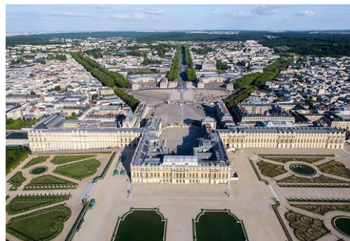
Le château de Versailles aujourd'hui