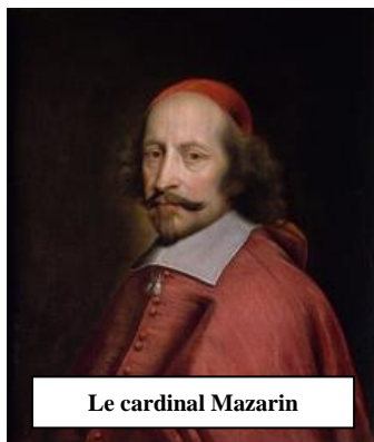
Le cardinal Mazarin